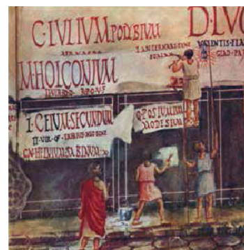
Recreación virtual: biblioteca Villa de los Papiros / Escritura en la vía pública con motivo de propaganda electoral (recreaciones)