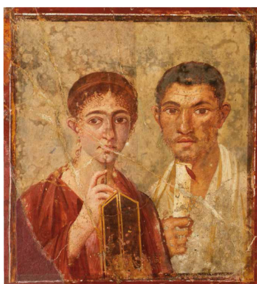
Terencio Neo y su mujer. S. I d.C.