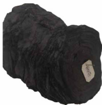
Rollo de papiro carbonizado.