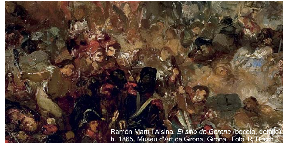
Ramón Martí i Alsina. El sitio de Gerona (boceto, detalle). h. 1865. Museu d'Art de Girona, Girona.

Teatro Fernán-Gómez. Centro de Arte 12 de febrero al 11 de mayo de 2008