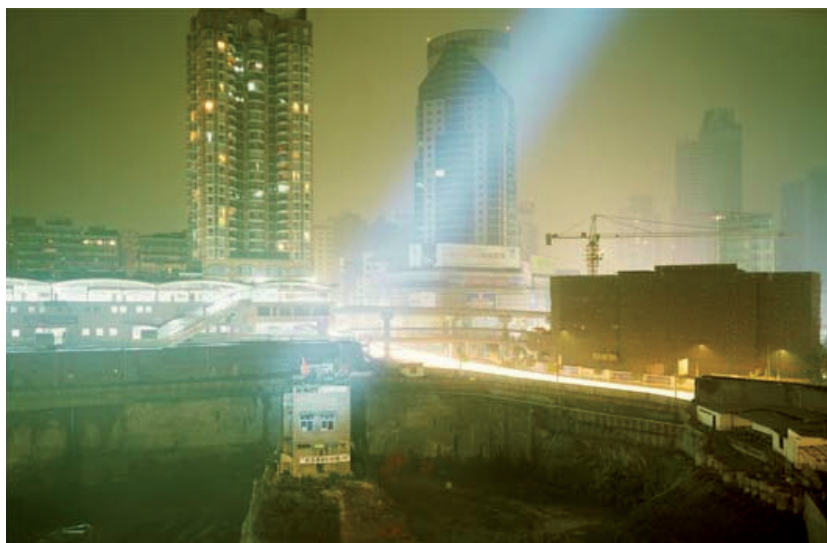
Jiang Zhi. Las cosas se volverían clavos una vez sucedieran , 2007 © Jiang Zhi