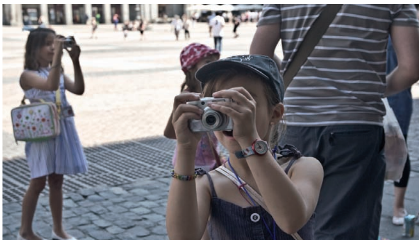
Salida a fotografiar Escuela de verano en MUICO

Durante una semana, la escuela de verano "Fotografía: el arte de preguntarse cosas" toma como punto de partida la exposición comisariada por Hou Hanru con motivo de la XIV edición del Festival PHotoEspaña 2011: "El poder de la duda", para acercar a niños y niñas al arte y los procesos creativos.