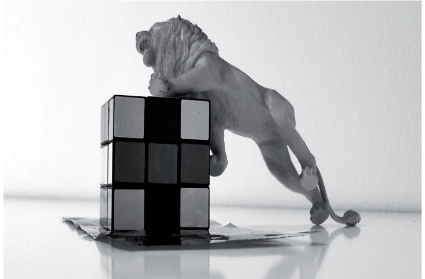
Foto de Rita Jiménez. 6 años Participante escuela de verano MUICO 2010