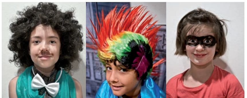
Participantes durante las actividades Escuela de verano en MUICO