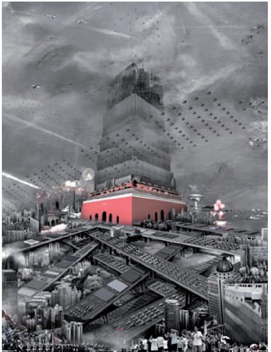
Du Zhenjun. Día nacional , de la serie "Supertorre". 2010 © Du Zhenjun