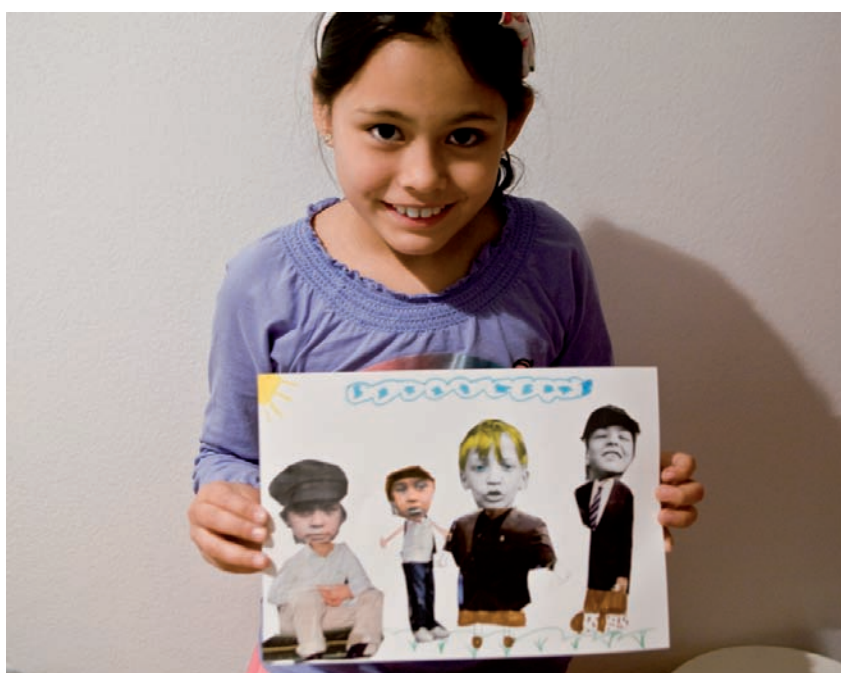
Obra de una participante Escuela de verano en MUICO © Sofía de Juan / Hablar en Arte