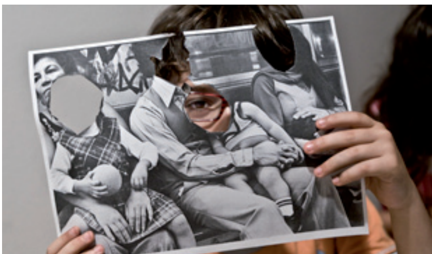
Obra de los participantes Escuela de verano 2010

Con las actividades educativas en MUICO, esperamos transmitir la idea de que un museo puede ser un lugar de divertimento y aprendizaje en el tiempo de ocio, pues el arte es un medio de expresión universal que nos permite conocer otras culturas, épocas y formas de vida.