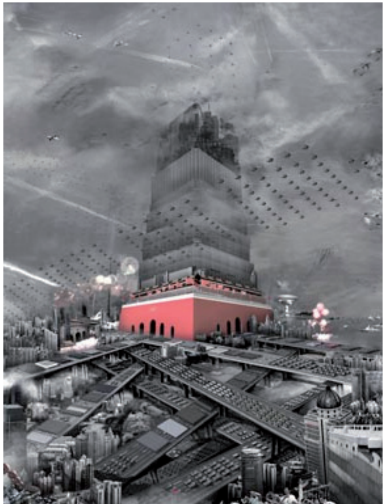
Du Zhenjun. Día nacional , de la serie “Supertorre”. 2010

Sus obras nos hacen pensar en temas que les preocupan como la inmigración, los ejércitos o las modas; pero, además, nos hacen preguntarnos cosas. Así, nos convertimos en los protagonistas de sus historias, porque nos permiten reflexionar, imaginar y soñar.