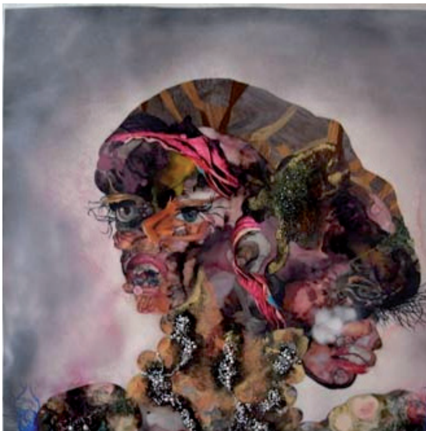
Wangechi Mutu. Dama repetida , 2010

El poder de la duda DOSSIER PARA FAMILIAS