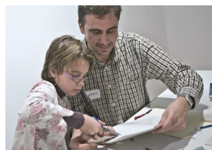
Actividades educativas en MUICO

En este museo vamos a descubrir el trabajo de los artistas de nuestra época. De esta forma, podremos conocer los diversos lenguajes y medios de los que se vale el arte actual para expresar todos los temas que a los artistas contemporáneos les preocupan.