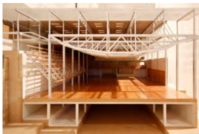
Miguel Fisac, Viga "hueso" del Instituto de Estudios Hidrográficos / Ladrillo diseñado por el arquitecto e ilustración del Instituto Cajal