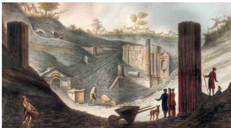
William Hamilton. Excavación del templo de Isis en Pompeya, 1776.