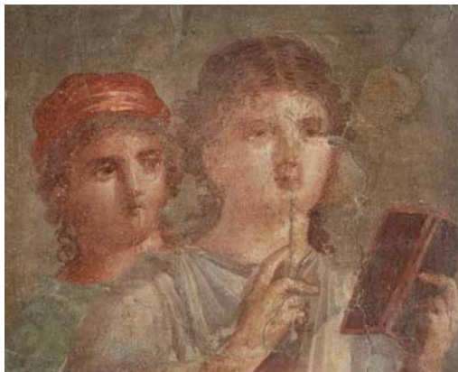
Dos jóvenes con tablillas y estilo, Pompeya, siglo I d.C.