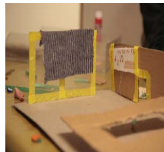
Desarrollo de la visita y del taller posterior en el Museo ICO

Tras la visita llevaremos a cabo un taller que nos permitirá poner en práctica lo que hemos aprendido previamente, basándonos fundamentalmente en los conceptos de reciclaje, solidaridad y cooperación. Siguiendo estas pautas, crearemos unos novedosos “recipientes” en los que la participación y cooperación entre todos los alumnos será fundamental para que lleguen a cumplir su función en el aula como contenedores de reciclaje.