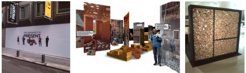
Imágenes del exterior y del proyecto de la exposición The Architect is Present .