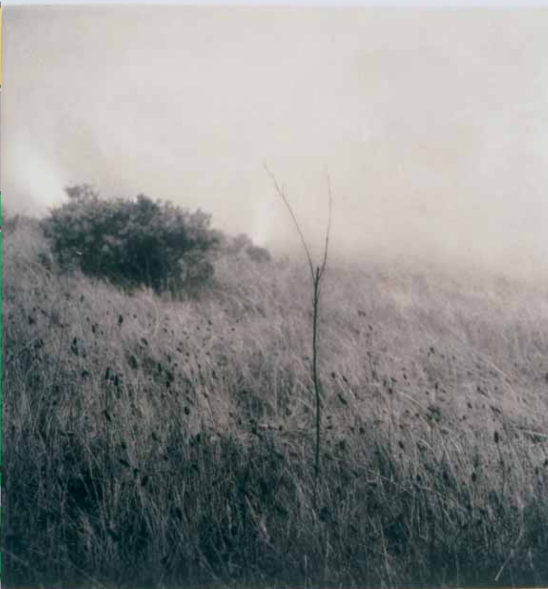
Unai San Martín, Grass on the fog , 2001 Colección de Arte Contemporáneo de la Comunidad de Madrid