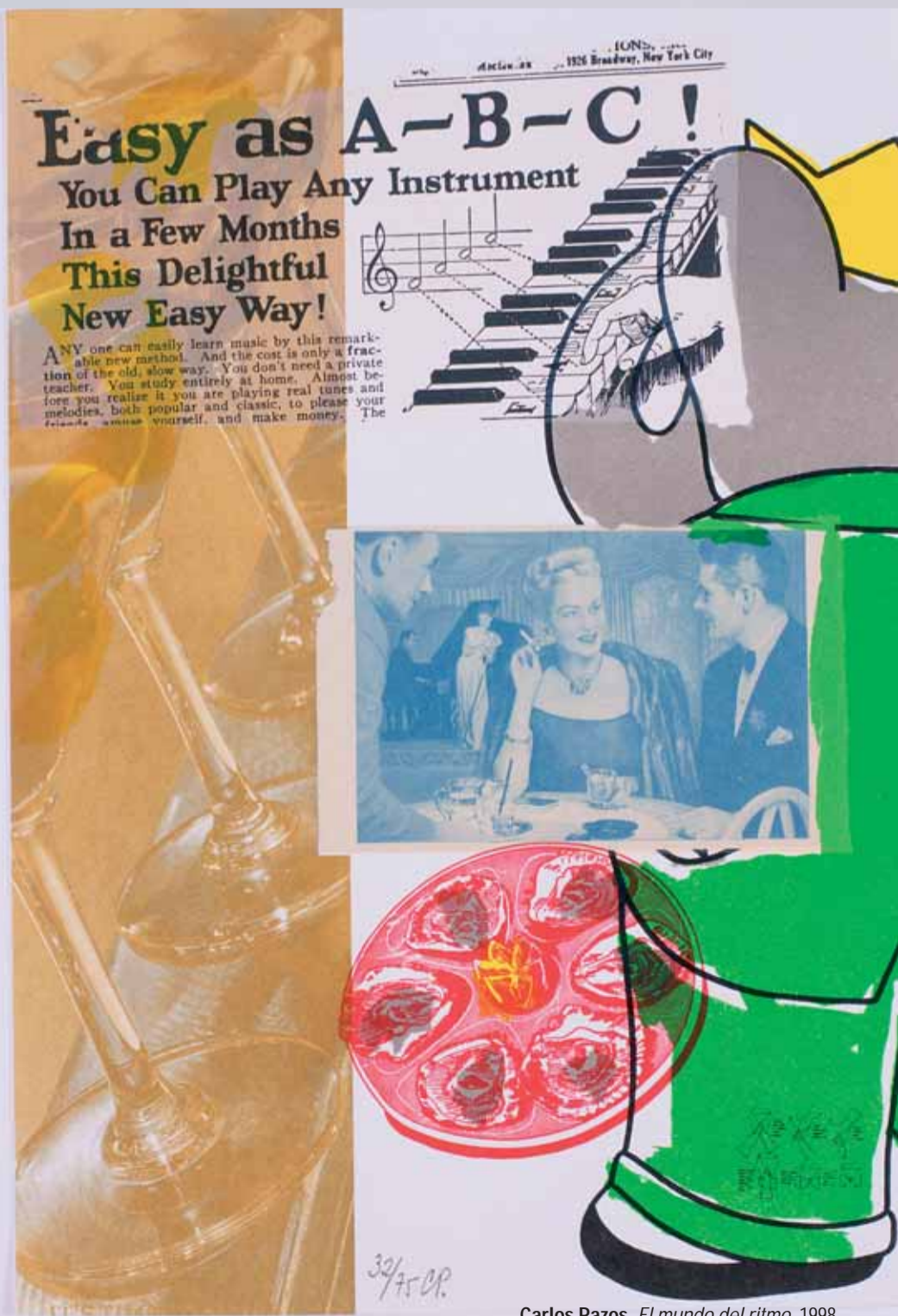
Carlos Pazos, El mundo del ritmo , 1998 Colección de Arte Contemporáneo de la Comunidad de Madrid