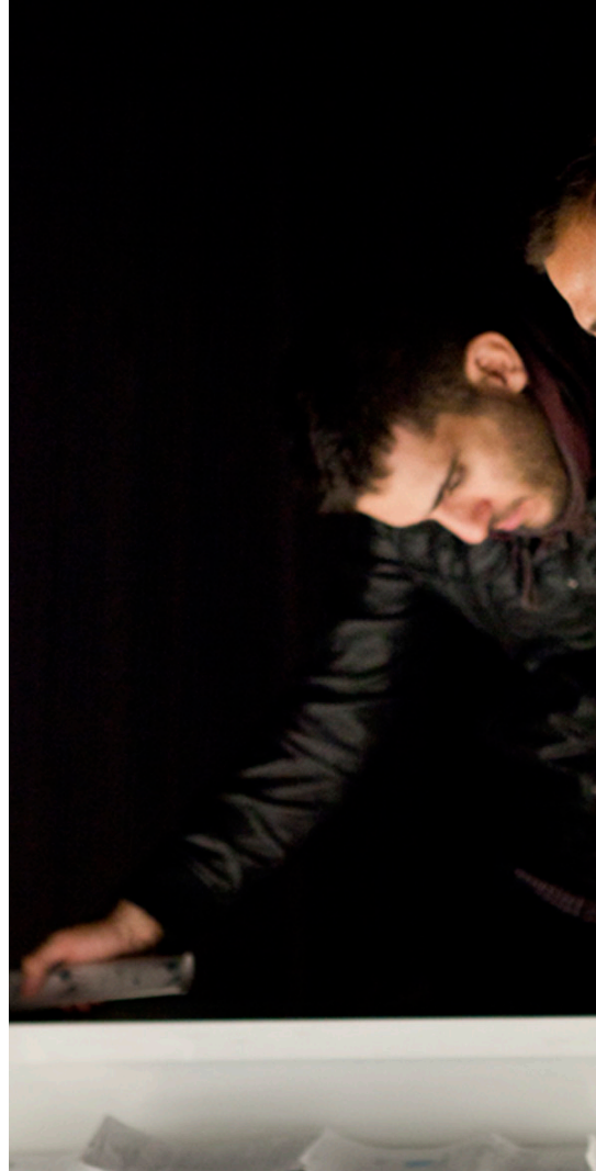
The activities of Curators’ Network at Intermediae have been supported by:

The members of Austria, Hungary, Poland and Romania will present three curated programs that issue alternative exhibition formats featuring artists, that have participated at the activities of Curators’ Network since 2011. On the other hand, hablarenarte : as the host and Spanish organizer will lead three seminars that trigger panel talks, round tables and open discussions around issues that we have been repeatedly confronted with during our collaboration within the network.