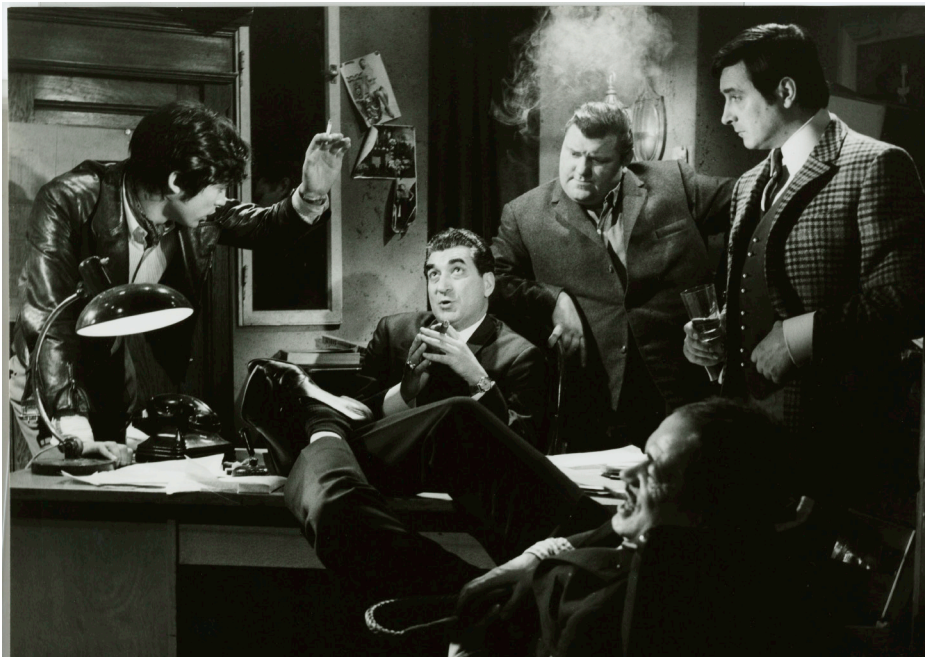
Still from the film "Schamlos" (Shameless), Austria 1968 Schamlos