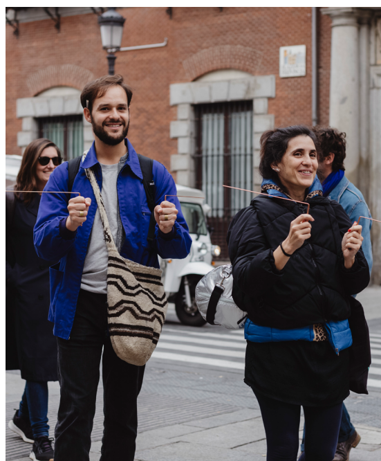
#Imagen 3 y 4: Programa de Acompañamiento.